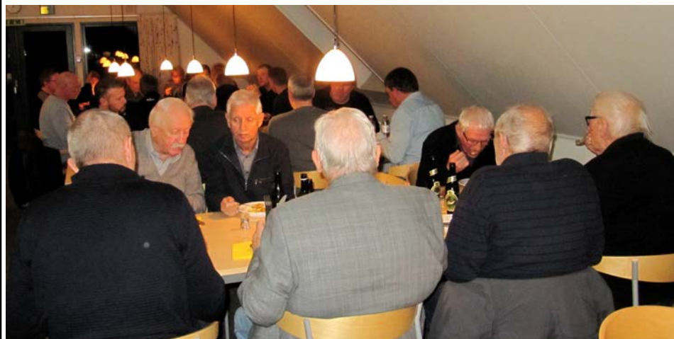
29 medlemmer havde tilmeldt sig spisningen før Generalforsamlingen.

TGB blev hædret ved at modtage prisen for årets anlæg 2018.