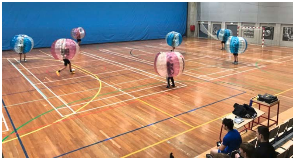
Bumper Balls i Valby Hallen.