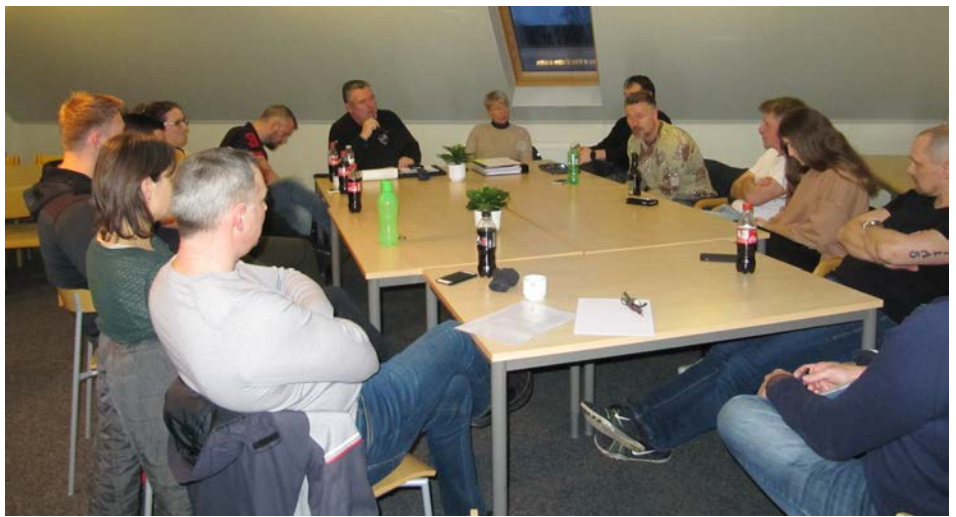
Ungdomstrænerne lyttede koncentreret til ungdomsformandens orientering.

bog, hvor man kan læse alt om, hvordan tingene fungerer i klubben.