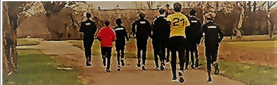
Løbetræning på landevejen kan være udmærkende, så synet bliver lidt sløret.

Vi mødte vores evige ærkerival Møns FK på kunststof Syd og kom stærkt tilbage efter at Møn chokstartede med 2 mål. Det endte med en 3-2 sejr til os. Vi har mødt BSF i Topdan-