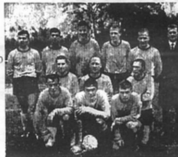
Holdet bestod af

Sportsligt set fik TGB et godt år i 1966 idet man suverænt vandt L.F.Serien og rykkede op i DS. Iøvrigt fik man også varme i klubhuset i Grønge idet klubben købte en brugt olieovn. Opholdet i DS. blev kun af kort varighed. Selvom holdet gjorde en god figur gennem enkelte sejre og mange knebne nederlag, måtte man året efter rykke ned i L.F.Serien igen.